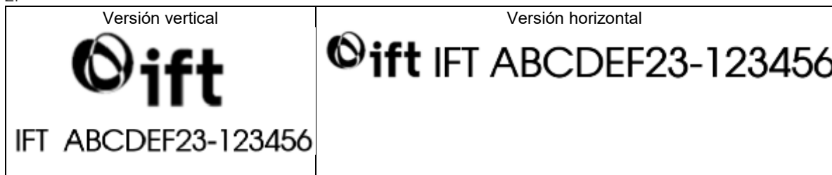
Figura 2.- Muestra gráfica de uso del Sello IFT, las siglas "IFT" en mayúsculas y el número de Certificado de Homologación, en el marcado o etiquetado de Productos homologados.

lineamiento Trigésimo octavo de los Lineamientos de Homologación, tal como se muestra en la figura 2.