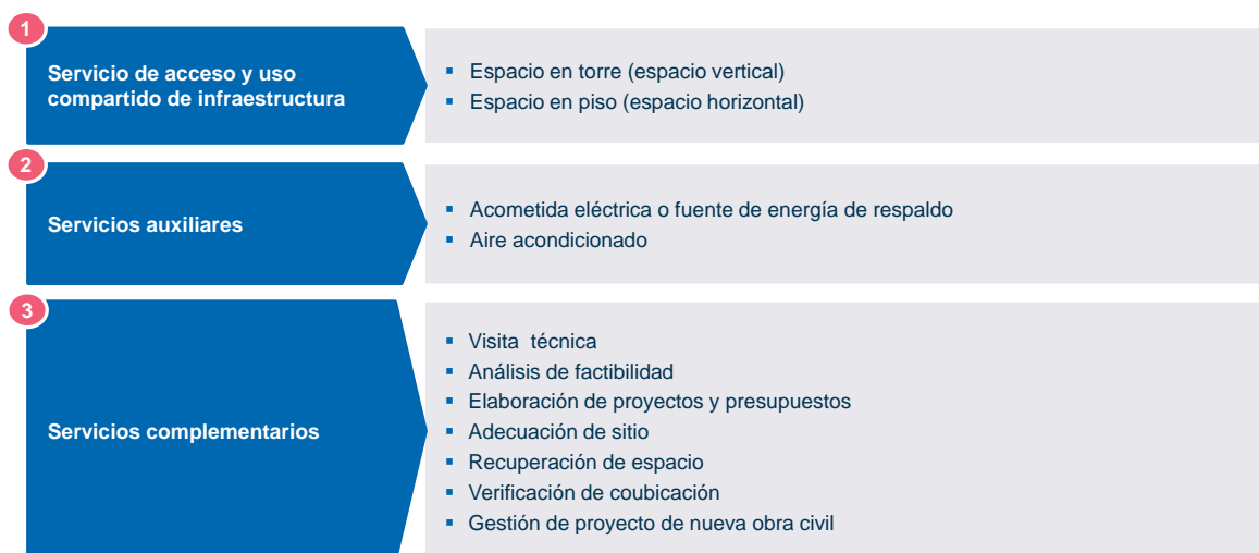
Figura 1: Servicios de acceso y uso compartido de infraestructura pasiva de redes móviles a ofertar por el AEP

Q.1: ¿Considera adecuados los servicios modelados en el modelo de coubicación móvil?