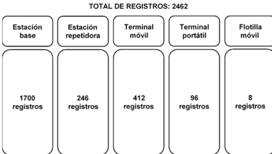
Figura 5. Ocupación actual del rango de frecuencias 162.300-162.600 MHz.

Adicionalmente, se hace notar que la banda de frecuencias 162.0375-174 MHz cuenta actualmente con la operación de un gran número de sistemas de los servicios fijo y móvil. En el caso particular del rango de frecuencias 162.300-162.600 MHz, el Sistema Integral de Administración del Espectro Radioeléctrico (SIAER) cuenta con un total de 2462 registros de sistemas de radiocomunicaciones, entre los cuales destacan las estaciones base, los repetidores, los equipos terminales móviles y portátiles, así como las flotillas móviles de diversas entidades gubernamentales, empresas paraestatales y usuarios privados. Dichos registros se muestran en la Figura 5.