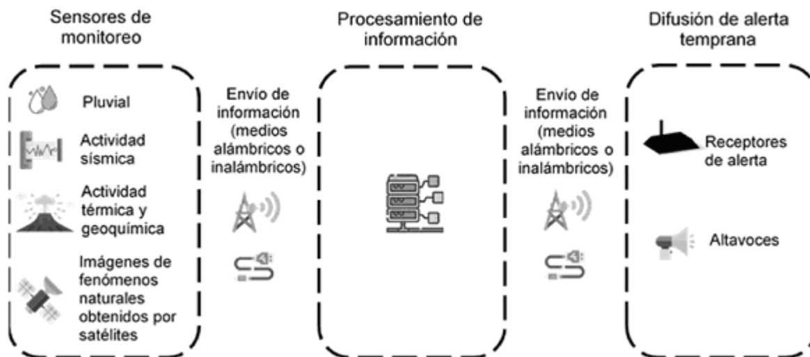
Figura 1. Diagrama de bloques de sistemas de alerta temprana

Los sistemas de alerta temprana cuentan con diversos tipos de sensores, por ejemplo, de movimiento para detectar actividad sísmica, térmicos y geoquímicos para el monitoreo de actividad volcánica, pluviales para la medición de cantidad de agua en un sitio, visuales por medio de satélites para distintos tipos de monitoreo, entre otros. La información obtenida por dichos sensores se envía, ya sea de manera alámbrica por un medio físico o inalámbrica por medio de frecuencias del espectro radioeléctrico hacia sistemas que procesan la información. Los sistemas de procesamiento analizan los datos recibidos y deciden si existe un riesgo por el cual se deba advertir a la población por medio de una alerta. En dicho caso, la alerta se difunde a la población a través de medios alámbricos o inalámbricos. El procedimiento descrito anteriormente puede apreciarse en la Figura 1 siguiente.