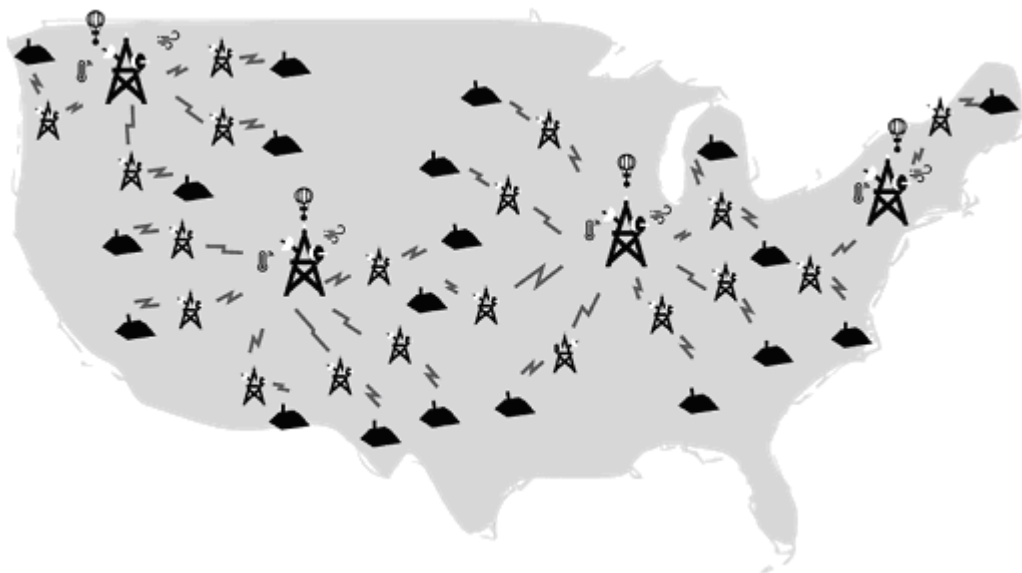
Figura 3. Representación del sistema de difusión NOAA

Con la finalidad de profundizar en el tópico, tenemos que en el ámbito internacional, la Administración Nacional Oceánica y Atmosférica (NOAA, por sus siglas en inglés), perteneciente al Departamento de Comercio de los Estados Unidos de América utiliza desde enero de 1975 las frecuencias 162.400 MHz, 162.425 MHz, 162.450 MHz, 162.475 MHz, 162.500 MHz, 162.525 MHz y 162.550 MHz, como la "voz del Servicio Meteorológico Nacional"(19) para proveer información meteorológica durante las 24 horas del día los siete días de la semana, así como para el envío de mensajes especiales de alerta referentes a inminentes amenazas a la vida y a las propiedades de las personas, como se muestra en la Figura 3.