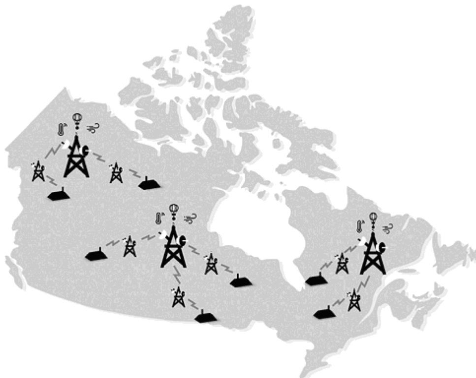
Figura 4. Representación del sistema de difusión de alertas meteorológicas en Canadá

Por otro lado, es relevante mencionar que colonias de la región de las Américas como Puerto Rico, las Islas Vírgenes, Samoa y Saipán, así como Guam también utilizan las frecuencias 162.400 MHz, 162.425 MHz, 162.450 MHz, 162.475 MHz, 162.500 MHz, 162.525 MHz y 162.550 MHz para la difusión de alertas meteorológicas.