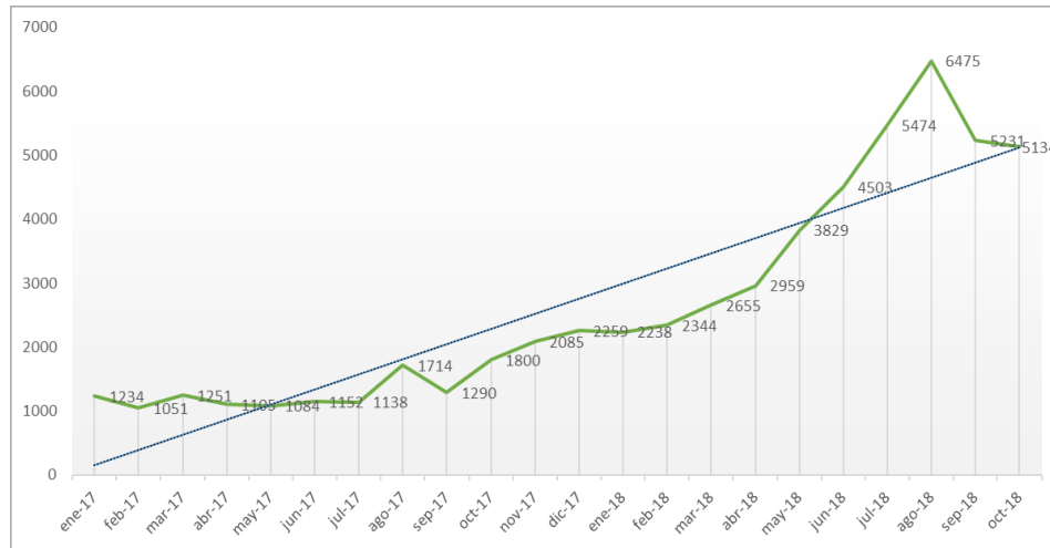
Gráfica 2. Estadísticas de reversiones de portabilidad.

Las cifras de los Procesos de Reversión realizados por el Administrador de la Base de Datos (en adelante, "ABD") del año 2017 con respecto al 2018 para las líneas móviles, muestran un considerable aumento de solicitudes de reversión. Cabe destacar, que la principal causa de dichos procesos ha derivado de solicitudes de Usuarios móviles que acudieron ante el Proveedor Donador sustentando que la portabilidad se llevó a cabo sin su consentimiento.