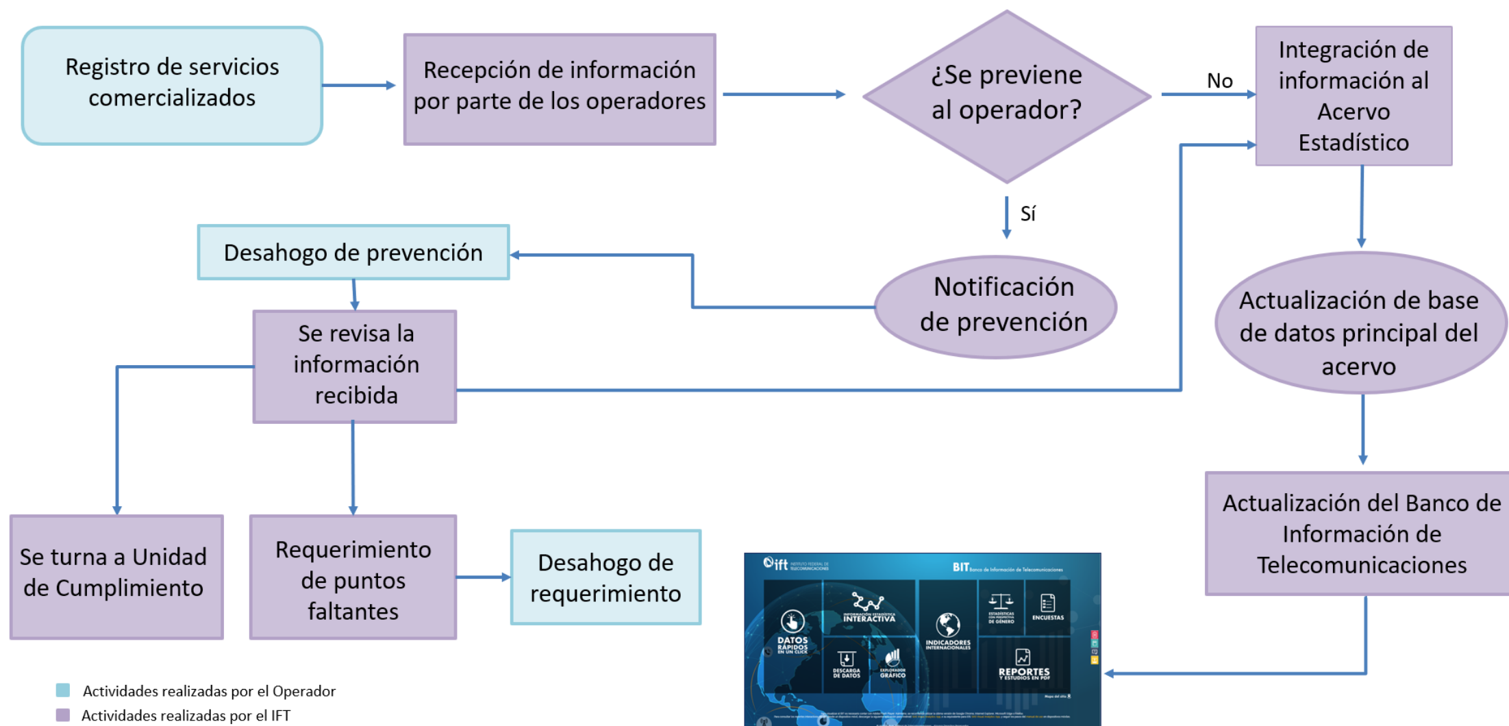
Diagrama de validación de información