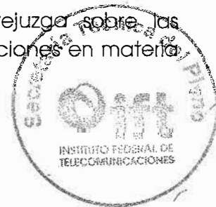
Gabriel Oswaldo Contreras Saldivar, Comisionado Presidente

Cuarto.- La presente Resolución se emite en el ámbito de aplicación del artículo 112 de la Ley Federal de Telecomunicaciones y Radiodifusión y no prejuzga sobre las atribuciones que correspondan al Instituto Federal de Telecomunicaciones en materia de competencia económica.