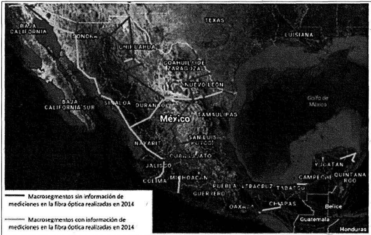
Figura 1. Macrosegmentos de hilos de fibra óptica de la CFE.