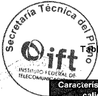
Tabla 5. Características y parámetros de calidad de los servicios adjudicados a Uninet en la Licitación SCT 2019