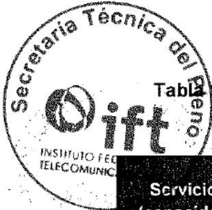
Tabla 17. Comparación del precio ofertado por el servicio y el costo del [redacted] 1