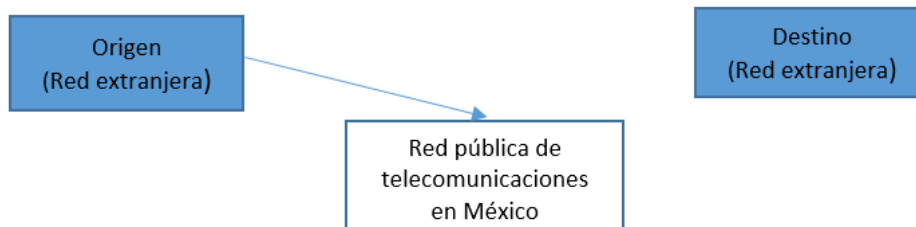
Imagen 2. Condición A.8. Tráfico en tránsito.

La prohibición prevista en la condición A.8. Tráfico en tránsito del Título de concesión y que es objeto de estudio en la presente resolución, estriba como se muestra en la imagen anterior, en que el tráfico en tránsito termine en una red pública de territorio nacional, en lugar de que la misma lo haga en territorio extranjero como debe realizarse atento a la definición de tráfico en tránsito antes citada.