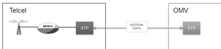
Figura 2 Integración de SMSC de un OMV para proveer servicios de SMS.