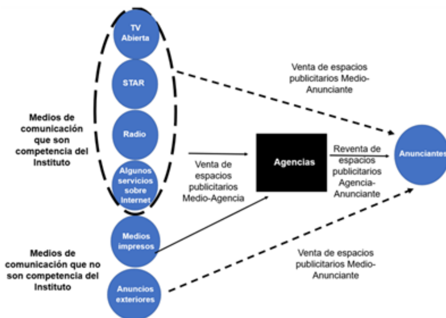
Figura 2. Relaciones entre los Medios, Agencias y Anunciantes.