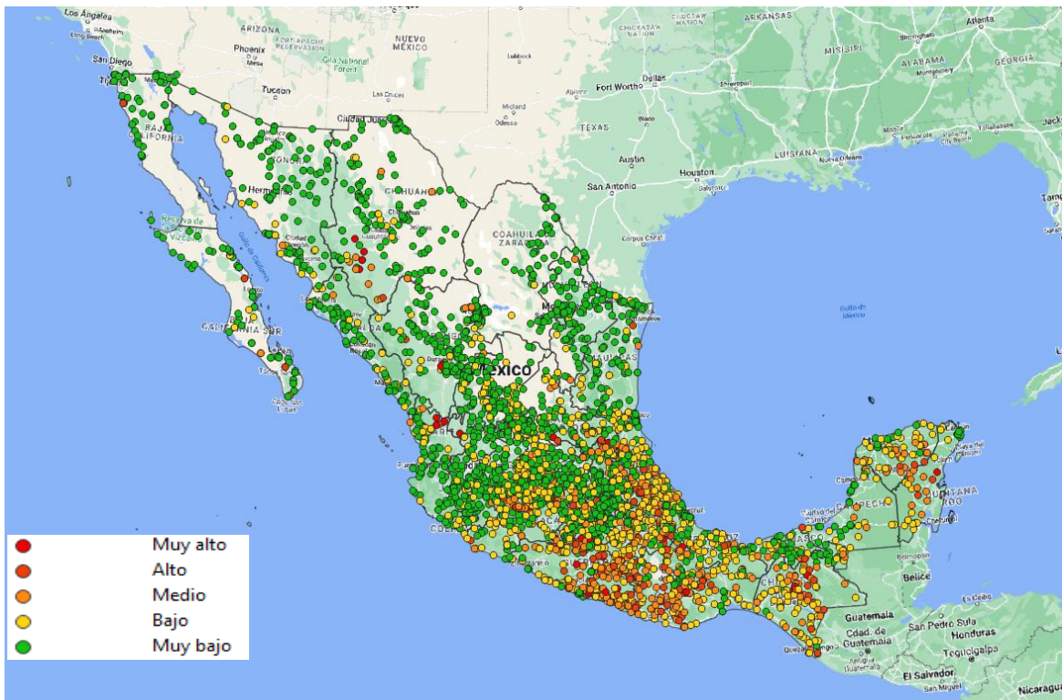
Figura 1: Mapa de clasificación de torres de Telmex y Telnor a partir del Índice de Marginación publicado por CONAPO.