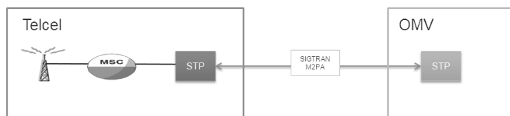
Figura 2 Integración de SMSC de un OMV para proveer servicios de SMS.