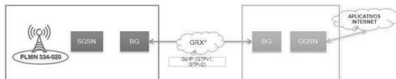
Figura 3 Integración del servicio de MMS de un OMV.