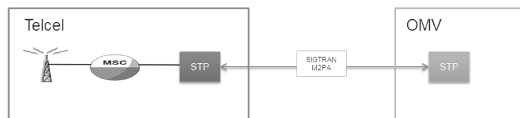
Figura 1 Integración del Buzón de voz de un OMV

Para este caso, el OMV deberá contar con su infraestructura de Buzón de voz, así como los enlaces suficientes para poder manejar el Tráfico de depósito / recuperación de sus Usuarios Finales. Adicionalmente será responsable, si así lo decide, de integrar los sistemas de notificación ( Message Waiting Indicator – MWI, SMS, Notificación de llamada abandonada). Las grabaciones que reproducirá el IVR de Buzón de voz (incluyendo grabación, secuencia, organización) son responsabilidad plena del OMV.