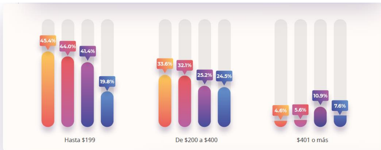
PAGO MENSUAL POR LA CONTRATACIÓN DE SERVICIOS OTT, POR GRUPOS DE EDAD

Nota. Respuesta espontánea. Debido a que excluye respuestas "No sabe/No contestó", la suma no da 100%.