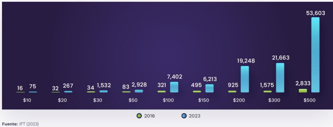
MB PROMEDIO INCLUIDOS POR MONTO DE RECARGA, 2016 Y 2023

En 2023 comparado con 2016, se identifica una mejora en la oferta de servicios de telecomunicaciones móviles, esta mejora se traduce en una mayor presencia de OMV en ambas modalidades de contratación, así como incrementos en la canasta de servicios incluida (Minutos de voz, SMS y MB).