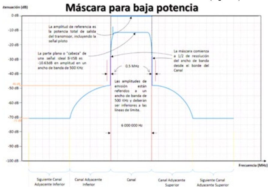
Figura 2. Máscara de emisión para Estaciones de Televisión y Equipos Complementarios de Baja Potencia

Donde \Delta f = Es la diferencia de frecuencia en MHz desde el borde de canal (Figura 2).