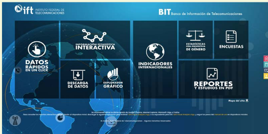
FIGURA 1. PÁGINA PRINCIPAL DEL BIT 3.0

El BIT es un sitio de internet donde es posible consultar de manera fácil, rápida e interactiva diversa información sobre los servicios fijos y móviles de telecomunicaciones con distintos niveles de desagregación.