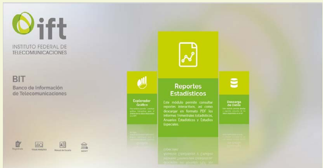
FIGURA 2. PÁGINA PRINCIPAL DEL BIT 1.0

Así, en 2015 se publicaron los primeros informes estadísticos en formato PDF acompañados de datos abiertos, y se inició el diseño de la página de internet del Banco de Información de Telecomunicaciones. Al momento de su publicación, el BIT 1.0 contenía 41 tablas de información en formato abierto, tableros interactivos para consulta y estudios e informes en formato PDF.