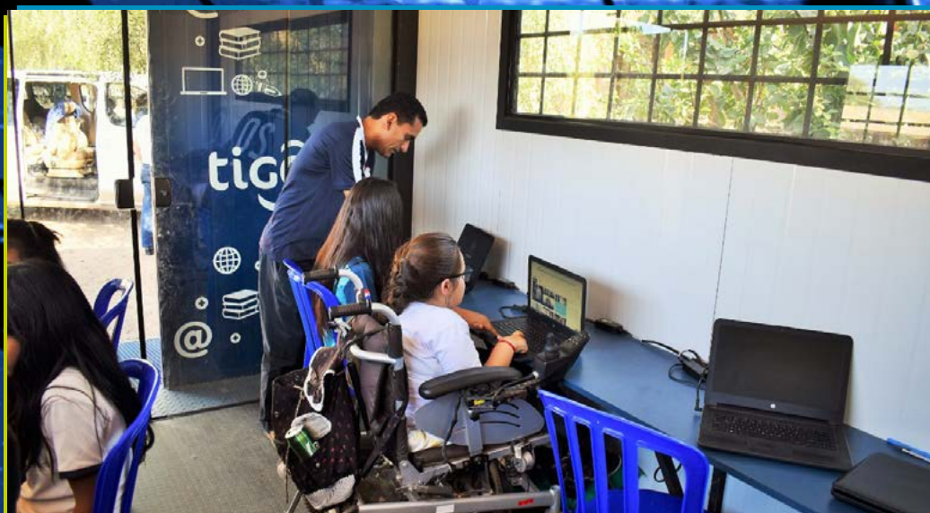
Registro fotográfico de la entrega por parte de la CONATEL de ordenadores portátiles a comunidades indígenas del Canindeyú, Escuela; La Esperanza y La Fortuna. Entrega de telecentros en todo el país.

Las mujeres han contribuido al desarrollo de la sociedad desde el comienzo de las civilizaciones; sin embargo, su labor debió superar barreras y obstáculos, para que sus hallazgos pudiesen ser apreciados por las comunidades científicas e intelectuales.